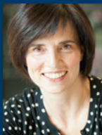
Mariann Wenckheim 20.20 Ltd., London (UK)